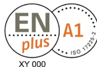
Certification des granulés de bois

Faire attention au système de certification « EN plus » et à la classe de qualité